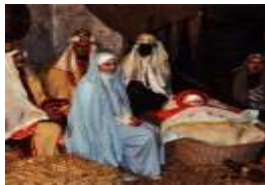
PRESEPE VIVENTE MONTEFIORE CONCA