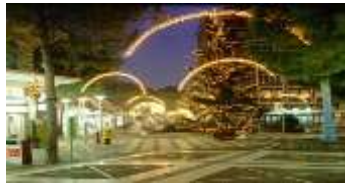
BELLISSIMO CENTRO VIALE CARDUCCI.